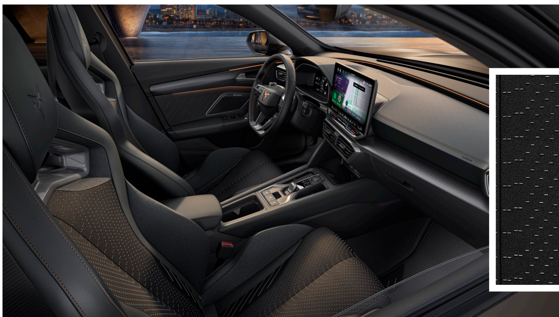
"Extreme Ambient" auduma / mikrošķiedras / ādas imitācijas sēdekļu apdare (standartā VZ Extreme versijai)