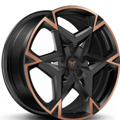
Vieglmetāla diski "Polar Copper" R19 (R9E, PD2)