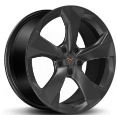
Vieglmetāla diski "Garbi Dark Shadow" R18 (standartā CUPRA versijai)