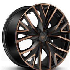
Vieglmetāla diski "Mistral Copper" R19 (R9G)