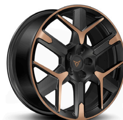
Vieglmetāla diski "Hailstorm Copper" R19 (R9N) (standartā VZ Extreme versijai)