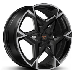
Vieglmetāla diski "Polar" R19 (PD1) (papildaprīkojums CUPRA versijai)