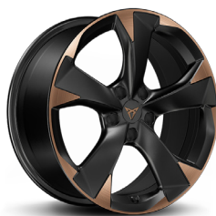
Vieglmetāla diski "Garbi Copper" R18 (R8E) (papildaprīkojums CUPRA versijai)