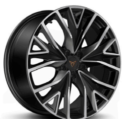
Vieglmetāla diski "Mistral" R19 (R9C)