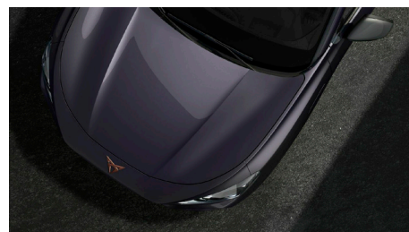
Dark Void (Q5Q5)