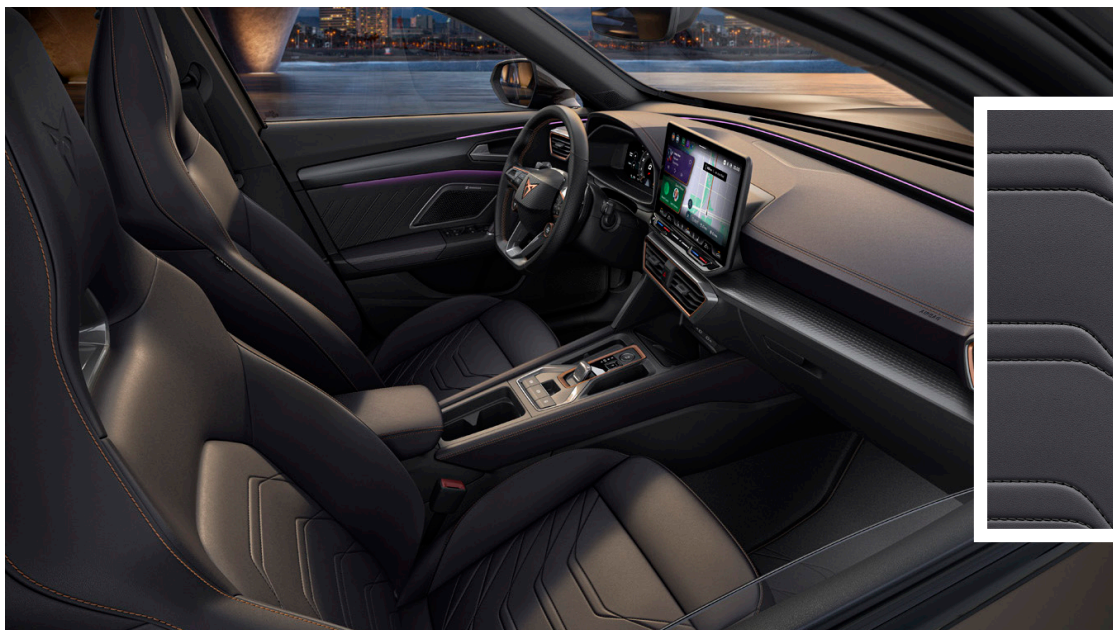
"Progressive Ambient" ādas / ādas imitācijas sēdekļu apdare (PR2)