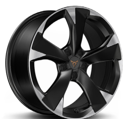
Vieglmetāla diski "Garbi" R18 (R8B) (papildaprīkojums CUPRA versijai)