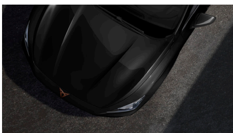
Midnight Black (OE0E)